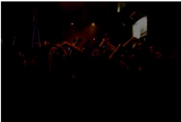
Figura 1: Marcha feminista en Estambul, 2020.

Seminario Universitario de la Modernidad: Versiones y Dimensiones (SUM), en colaboración con el International Research Group on Authoritarianism and Counter-Strategies (IRGAC), invitan al Coloquio Internacional: Autoritarismo, Estrategias Anti-autoritarias y Nuevos Horizontes Utópicos 28 de noviembre de 2024 Casa de las Humanidades (UNAM)